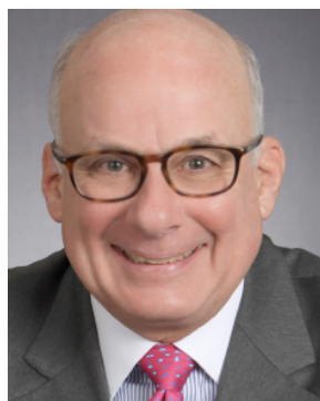
编辑: Dennis Unkovic